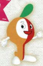
かわさき ミュートン