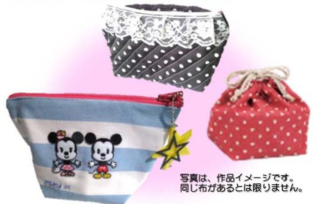
写真は、作品イメージです。 同じ布があるとは限りません。