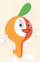
かわさきミュートン