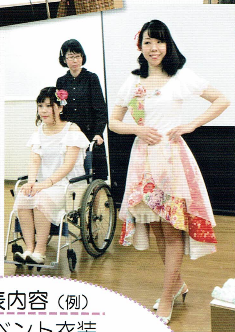
【写真】 昨年の発表会の模様